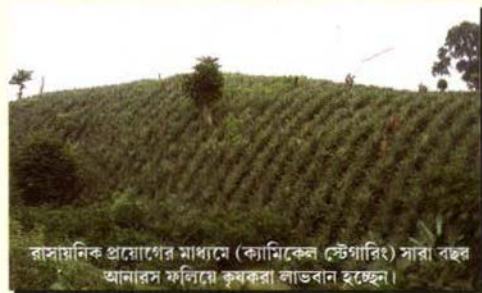
রাসায়নিক প্রয়োগের মাধ্যমে (ক্যামিকেল স্টেগারিং) সারা বছর আনারস ফলিয়ে কৃষকরা লাভবান হচ্ছেন।